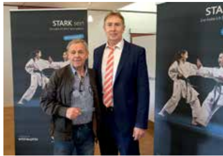
2. Platz Budokan Bochum