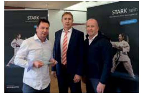
3. Platz Bushido Köln