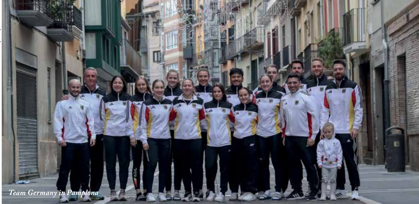
Team Germany in Pamplona