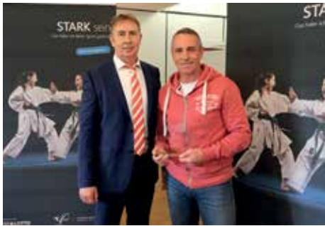
1. Platz USC Duisburg