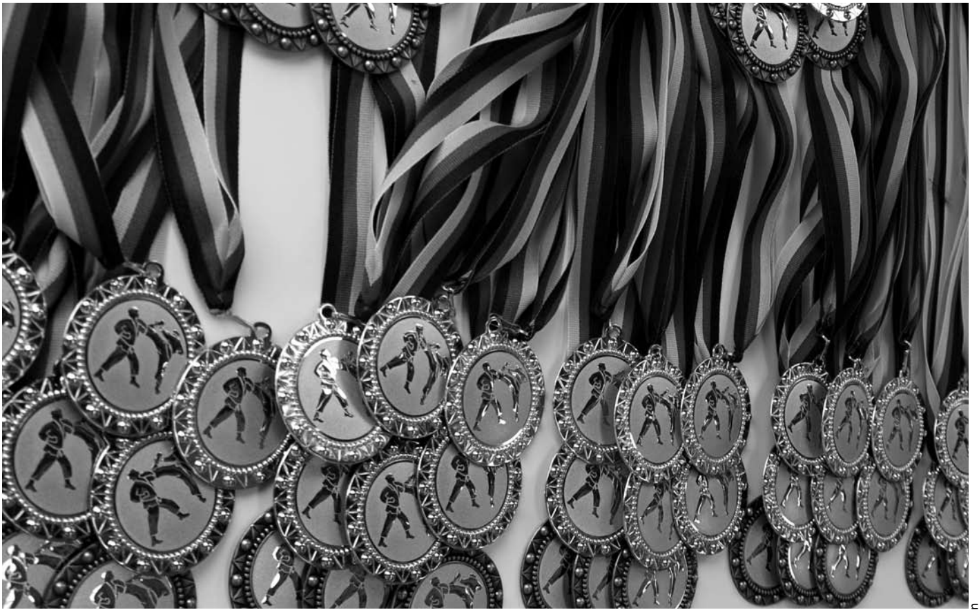
Jede Menge Medaillen und Pokale sind derzeit auszukämpfen. Nervenkitzel und langfristige Vorbereitungen inklusive!