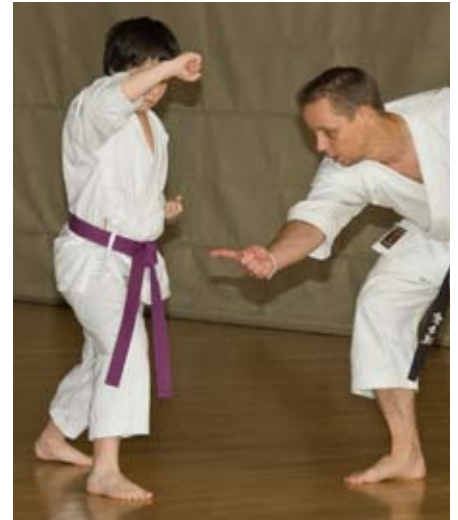
Mit Anspannung erwarten die Athletinnen und Athleten das Urteil der Kadertrainer. Nicht immer fiel es für den Kids leicht, die Übungen umzusetzen.

Am 23.01.2010 fand zum wiederholten Male das Trainermeeting beim TSC Eintracht Dortmund statt. Nach der Begrüßung begann das Landeskadertraining im Bereich Kata. „Angetreten“ sind bereits bewährte Sporttalente aus dem Beobachtungs-, Leistungs- und Topkader. Darüber hinaus kamen auch neue Kinder und Jugendliche zur Talentsichtung. Aber wie genau läuft denn so eine Talentsichtung ab? Kann da jeder vorbeikommen und sich sichten lassen? Welche Kriterien gilt es zu erfüllen?