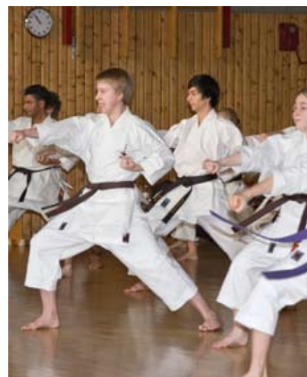
Anspannung und Entspannung, Basiselemente im Karate-Do, konnten auch beim Trainermeeting in Dortmund erfahren werden. Das Resultat: Frohe Gesichter!