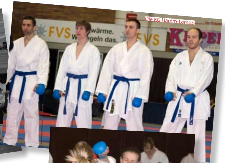
Die KG Hamm-Lemgo