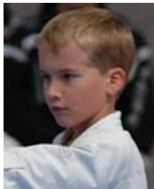
Roman Lux Satori Hilden, Kata T-Kader